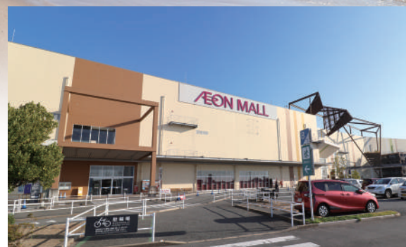
イオン福津店 車14分 / 5,400m