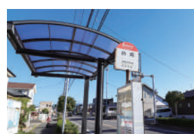
西鉄「的岡」バス停 徒歩3分 / 200m