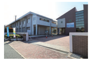
津屋崎中学校 徒歩5分 / 400m