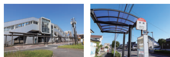
JR鹿兒島本線「福岡」駅 車8分 / 3,200m