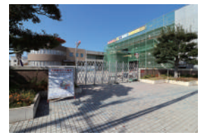
津屋崎小学校 徒歩17分 / 1,300m