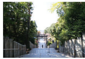
宮地嶽神社 車で3分 / 1,000m

【物件概要】●所在地番/福岡県福津市宮司5丁目1754-33他●住居表示/福岡県福津市宮司5丁目33番14号他●交通/JR鹿兒島本線「福岡」駅まで車で8分(3,200m)・西鉄バス「的岡」バス停まで徒歩3分(200m)●総区画数/17区画●建ぺい率・容積率/50%・80%●地目/宅地●取引形態/売主●建築確認番号/第R05SHC119591他●私道負担/無し●設備/公営上下水道、九州電力 【第1期販売概要】●販売棟数/4棟●価格/3,698万円~3,998万円(税込)●土地面積/205.56㎡(62.18坪)~206.03㎡(62.32坪)●建物面積/112.2㎡(33.94坪)~115.92(35.06坪)●工事了年月/2024年1月完成済●引渡可能年月/即入居可(諸手続き完了後)●接道・道路幅員/(1号地)南西側:8,008m・5,523m/(2号地)南西側:8,087m・5,512m/(16号地)北東側:8,075m・5,539m/(17号地)北東側:8,034m・5,542m【第2期販売概要】●販売棟数/4棟●価格/3,798万円・3,948万円(税込)●土地面積/205.56㎡(62.18坪)~205.71㎡(62.22坪)●建物面積/110.12㎡(33.31坪)~116.75(35.31坪)●工事了年月/2024年2月完成済●引渡可能年月/即入居可(諸手続き完了後)●接道・道路幅員/(3号地)南西側:8,077m・5,519m/(4号地)南西側:8,082m・5,522m/(14号地)北東側:8,081m・5,541m/(15号地)北東側:8,075m・5,541m ※広告有効期限/2024年5月末日