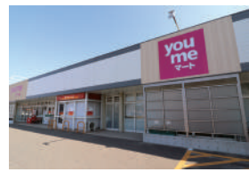
ゆめマート 津屋崎 車で4分 / 1,400m